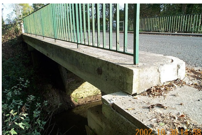
Le repère est au centre de la photo

Remarques : Exploitable par GPS depuis une station excentrée