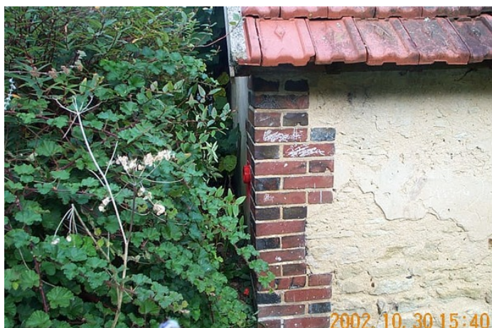
Le repère est au centre de la photo

Remarques : Exploitable par GPS depuis une station excentrée